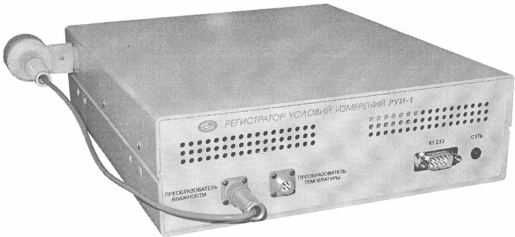
Рисунок 1 - Внешний вид регистратора условий измерений РУИ-1

Схема пломбировки регистратора условий измерений РУИ-1 для защиты от несанкционированного доступа с указанием места для нанесения оттиска знака поверки приведена в приложении А.