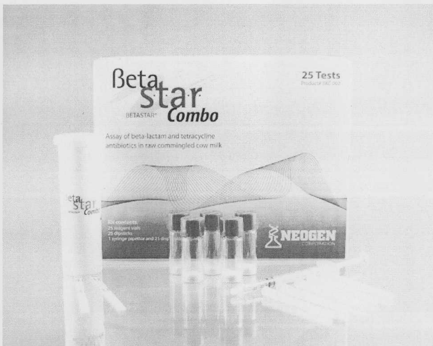
Рисунок 2 – Внешний вид набора для экспресс-анализа Beta Star® COMBO 25