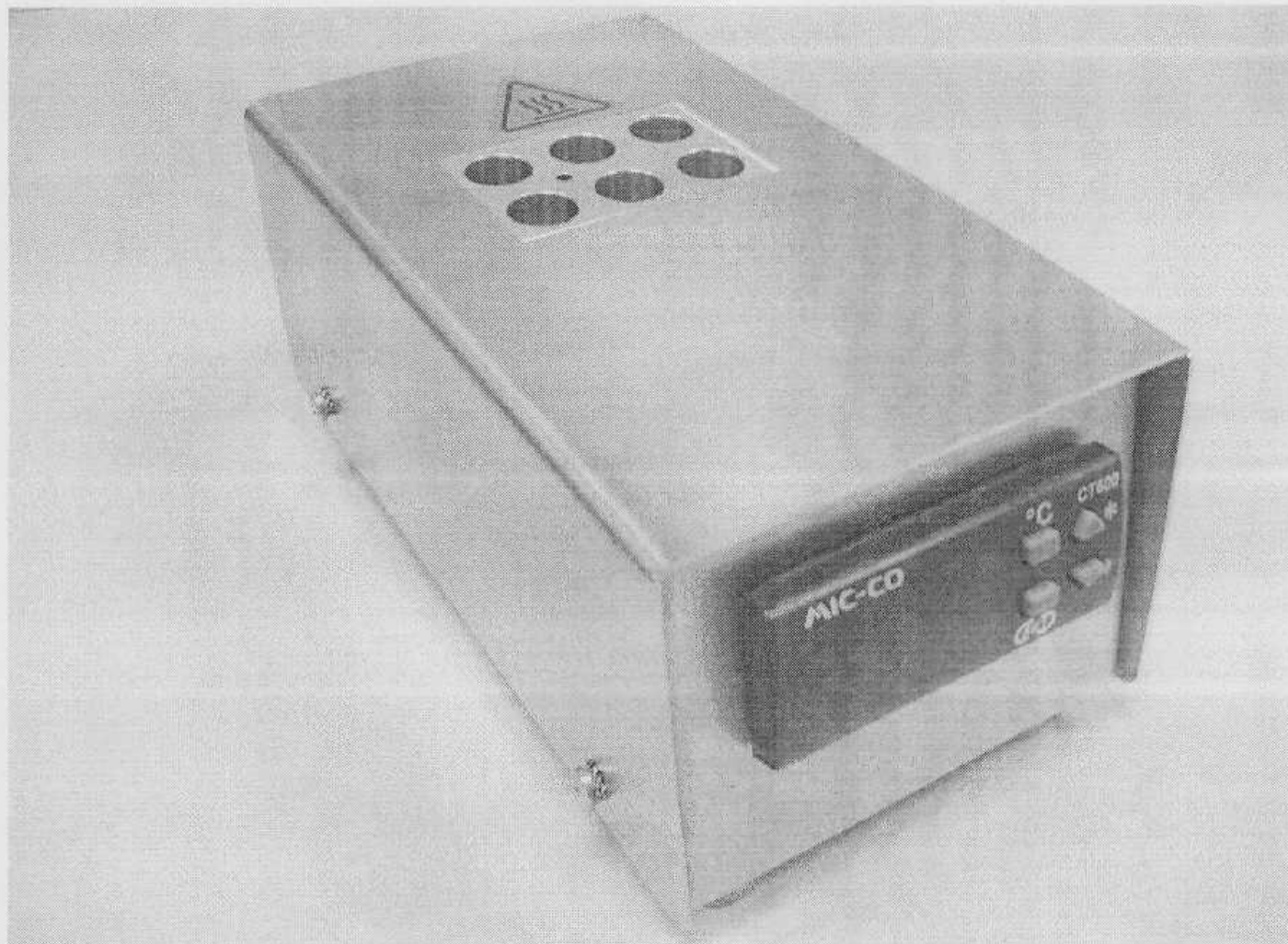
Рисунок 1 – Внешний вид термостата-инкубатора BetaStar COMBO

Внешний вид термостата-инкубатора BetaStar COMBO и набора для экспресс-анализа Beta Star® COMBO 25 приведен на рисунках 1 и 2 соответственно.