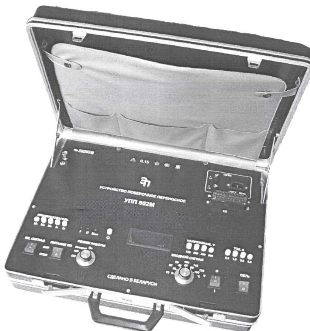
Рисунок 2 – Фотография общего вида