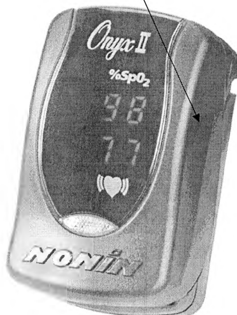
Рисунок А.3 - Место нанесения знака поверки в виде клейма-наклейки на оксиметры Onyx 9550

Место нанесения знака поверки (клеймо-наклейка)