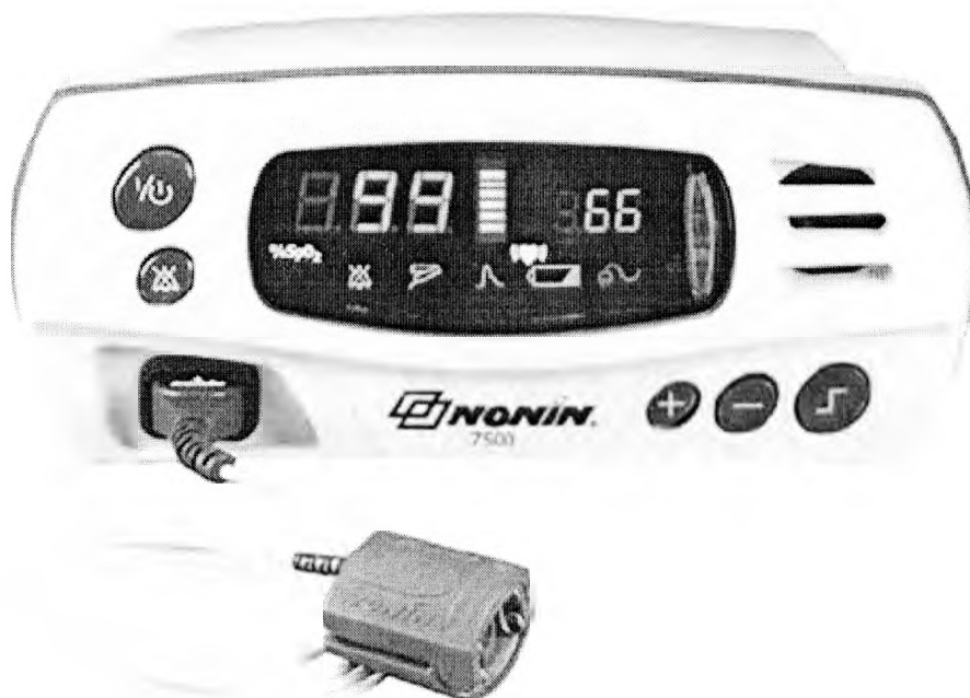
Рисунок 1 – Оксиметр 7500FO

Общий вид оксиметров представлен на рисунках 1 - 6.