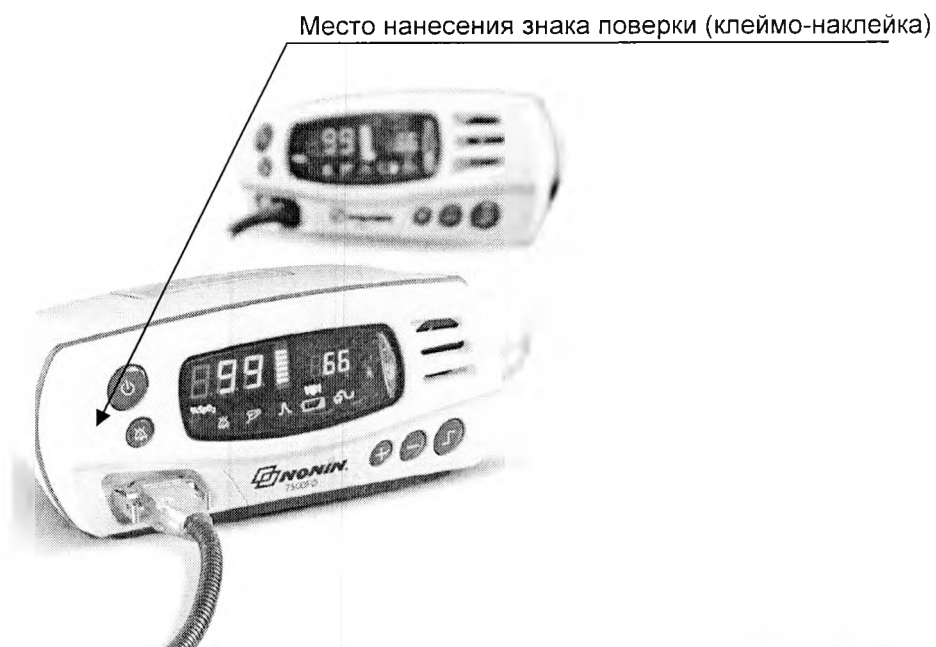
Рисунок А.2 - Место нанесения знака поверки в виде клейма-наклейки на оксиметры 7500FO