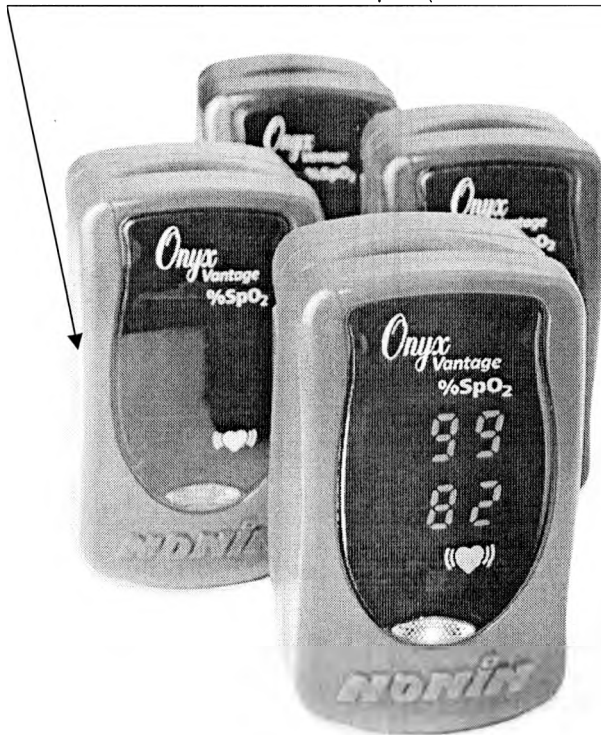
Рисунок А.5 - Место нанесения знака поверки в виде клейма-наклейки на оксиметры Onyx Vantage 9590

Место нанесения знака поверки (клеймо-наклейка)