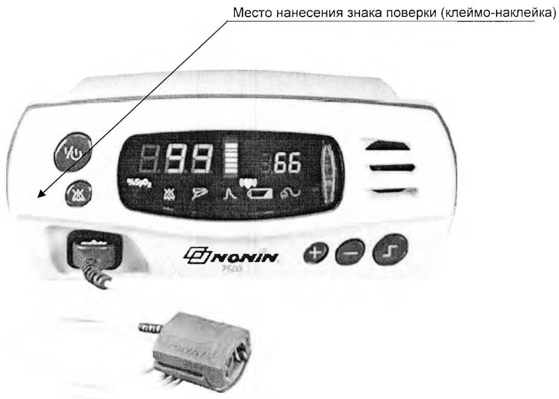
Рисунок А.1 - Место нанесения знака поверки в виде клейма-наклейки на оксиметры 7500

Схема с указанием места нанесения знака поверки (клеймо-наклейка)