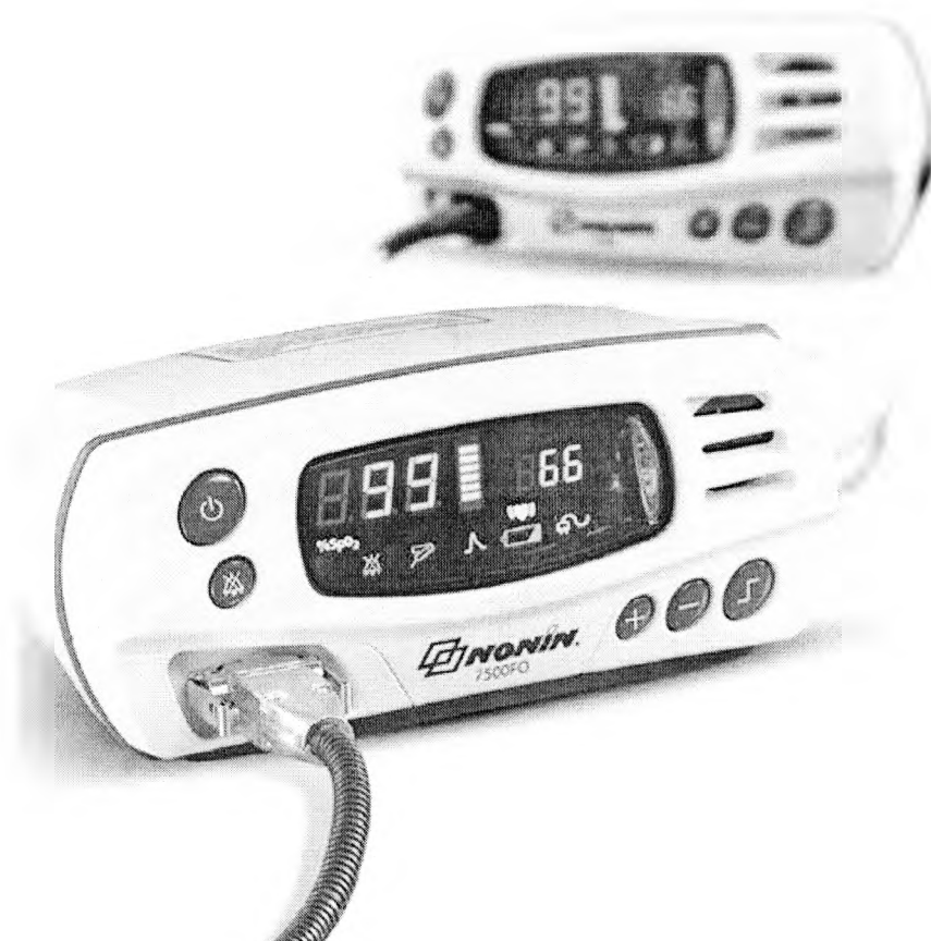
Рисунок 2 – Оксиметр 7500