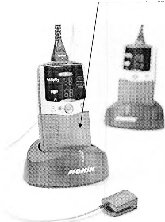
Рисунок А.4 - Место нанесения знака поверки в виде клейма-наклейки на оксиметры PalmSAT 2500, PalmSAT 2500A

Место нанесения знака поверки (клеймо-наклейка)