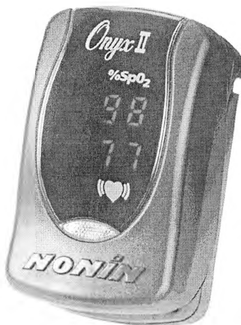
Рисунок 3 – Оксиметр Onyx 9550