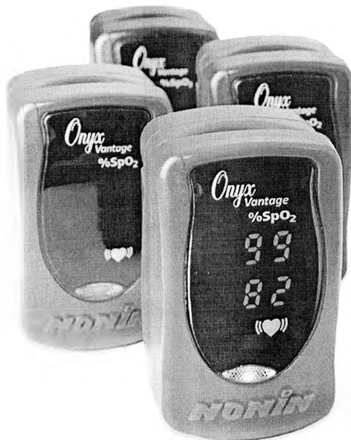
Рисунок 5 – Оксиметр Onyx Vantage 9590