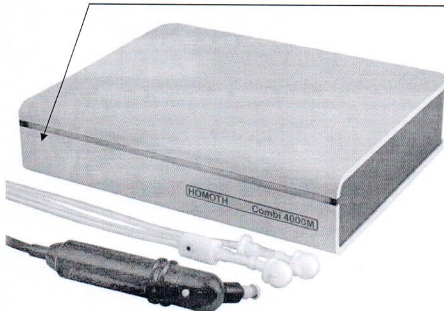
Рисунок А.2 - Место нанесения знака поверки в виде клейма-наклейки на приборы диагностические комбинированные Combi 4000 (модификация Combi 4000 M)

Место нанесения знака поверки (клеймо-наклейка)