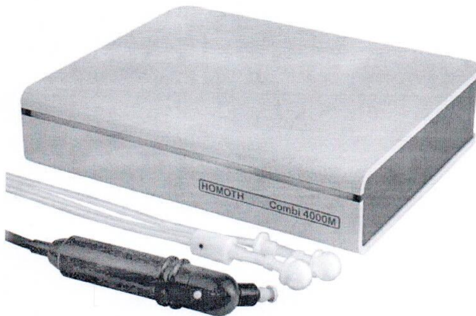
Рисунок 2 – Прибор диагностический комбинированный Combi 4000 (модификация Combi 4000 M)