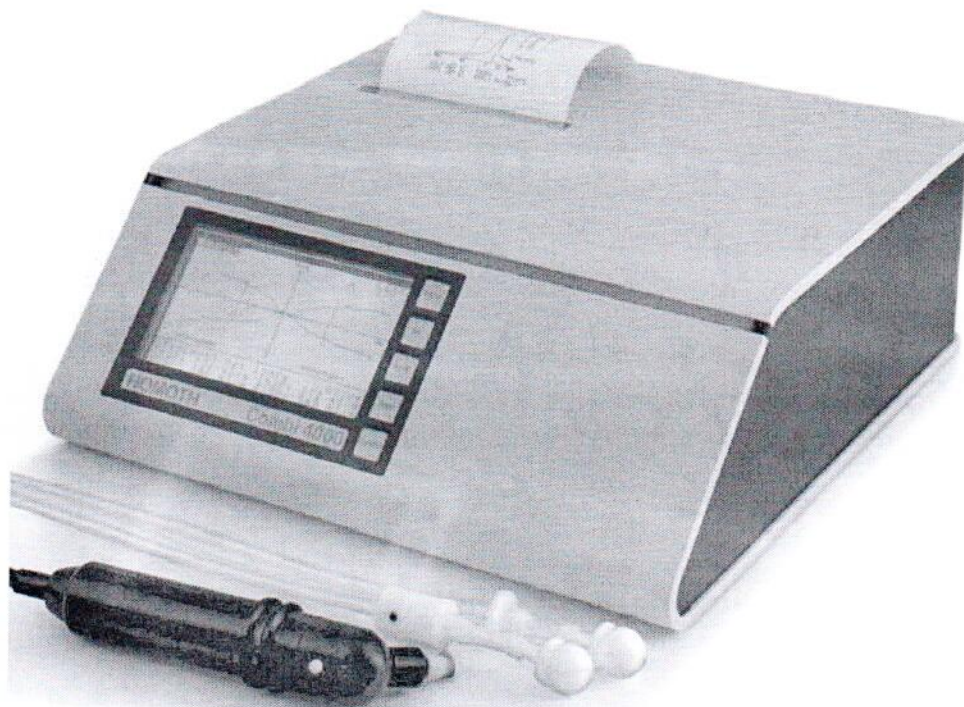
Рисунок 1 – Прибор диагностический комбинированный Combi 4000 (модификация Combi 4000)

Общий вид приборов представлен на рисунках 1 - 2.