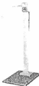
Фотография общего вида РП