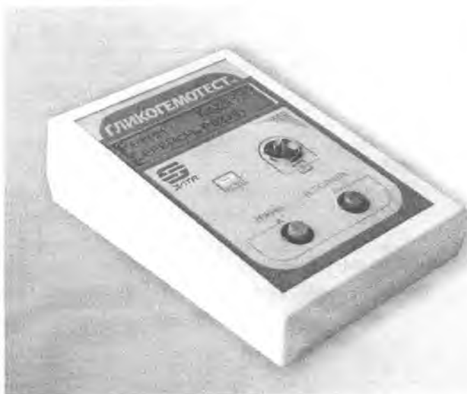
Рисунок 1. Внешний вид прибора.

Прибор имеет неразъемный корпус, исключающий несанкционированный доступ к его метрологически значимой части.