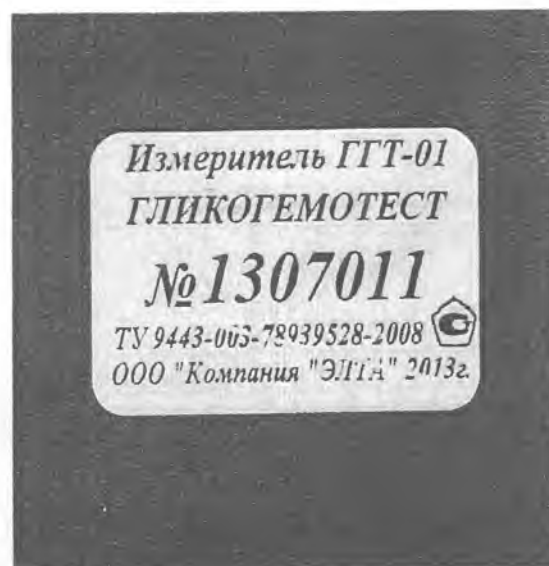
Рисунок 2. Схема маркировки.