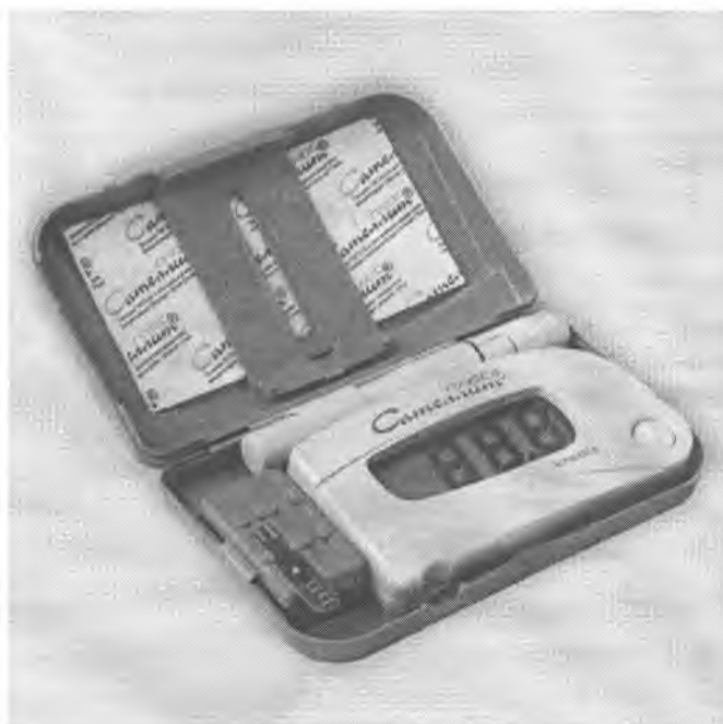
Рисунок 1 – Общий вид экспресс - измерителей

Принцип действия экспресс-измерителей основан на измерении электрического тока, вызванного реакцией глюкозы пробы крови с ферментом глюкозооксидазы. Измеренный ток пропорционален концентрации глюкозы в анализируемой пробе крови. Результат измерения обрабатывается микропроцессорным устройством и отображается на экране встроенного жидкокристаллического дисплея в единицах ммоль/л, а также записывается в памяти системы.