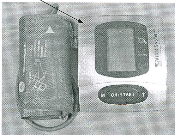
Рисунок 3 – Место нанесения знака поверки (клеймо-наклейка) на измеритель КР6920 (PBG-902)

место нанесения знака поверки (клеймо-наклейка)