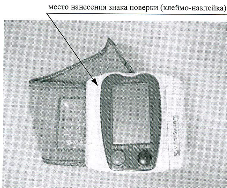
Рисунок 2 – Место нанесения знака поверки (клеймо-наклейка) на измеритель КР6130 (PBG-831)