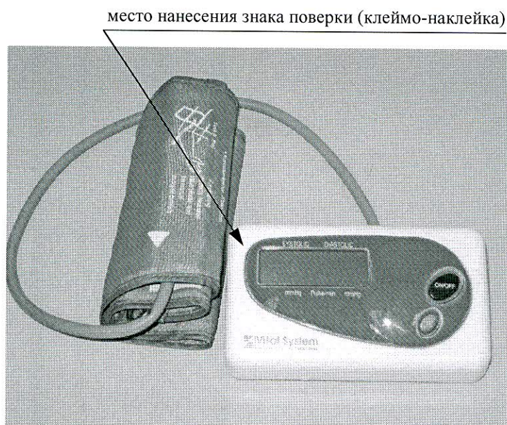
Рисунок 1 – Место нанесения знака поверки (клеймо-наклейка) на измеритель КР6821 (PBG-829)