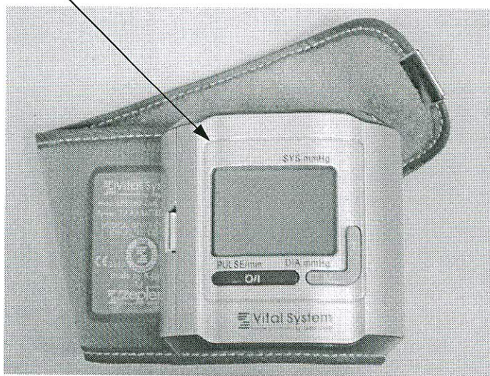
Рисунок 4 – Место нанесения знака поверки (клеймо-наклейка) на измеритель КР6240 (PBG-903)

место нанесения знака поверки (клеймо-наклейка)