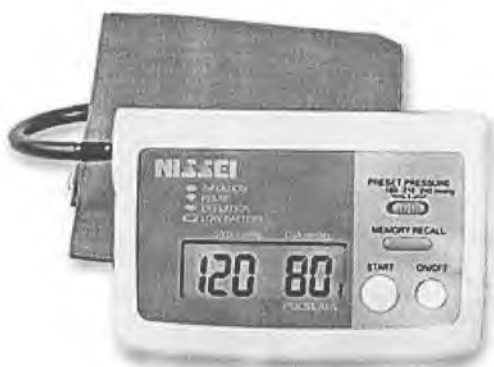
Рисунок 11 – Измеритель DS-157