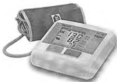
Рисунок 17 – Измеритель DS-700