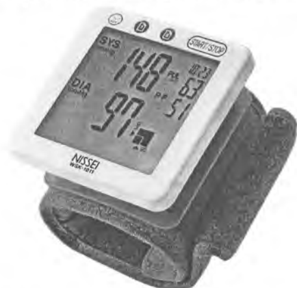
Рисунок 20 – Измеритель WS-1011