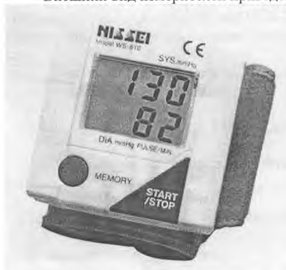
Рисунок 1 – Измеритель WS-610

Внешний вид измерителей приведен на рисунках 1– 21.