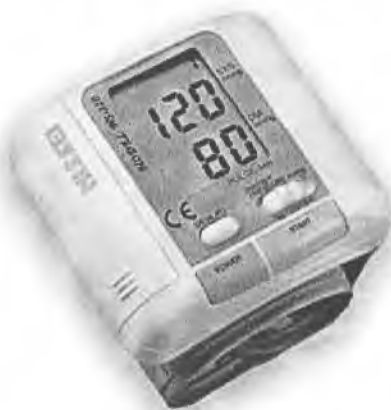
Рисунок 13 – Измеритель WS-320