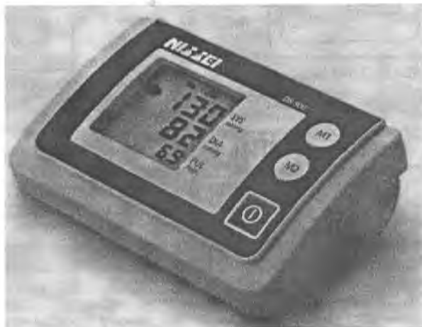
Рисунок 8 – Измеритель DS-500