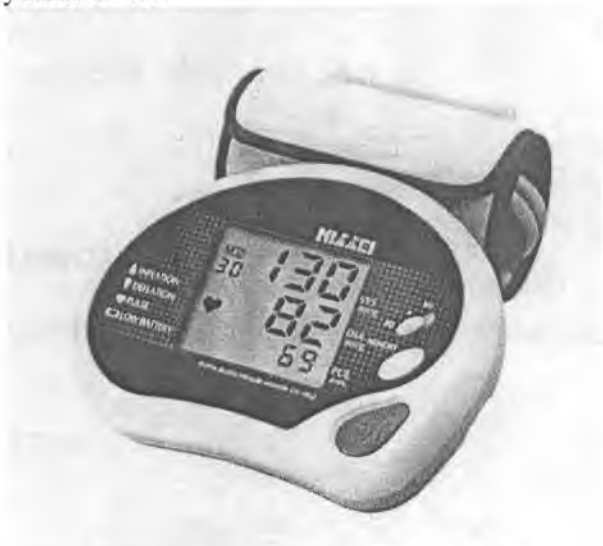
Рисунок 2 – Измеритель DS-1862