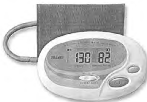
Рисунок 12 – Измеритель DS-182