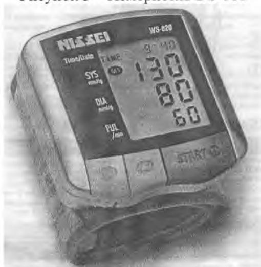
Рисунок 5 – Измеритель WS-820