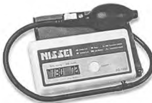
Рисунок 10 – Измеритель DS-105E