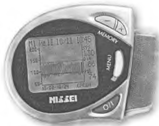
Рисунок 16 – Измеритель WS-720