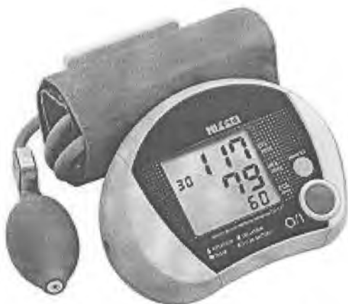
Рисунок 15 – Измеритель DS-137