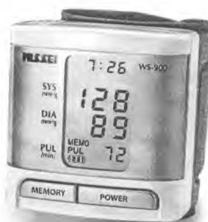
Рисунок 21 – Измеритель WS-900