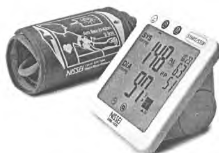
Рисунок 18 – Измеритель DS-1031