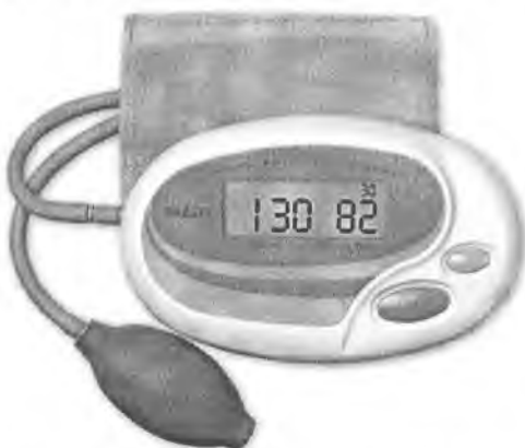
Рисунок 9 – Измеритель DS-132