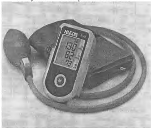
Рисунок 6 – Измеритель DS-400