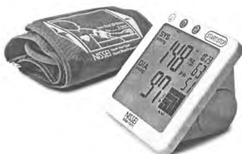
Рисунок 19 – Измеритель DS-1011