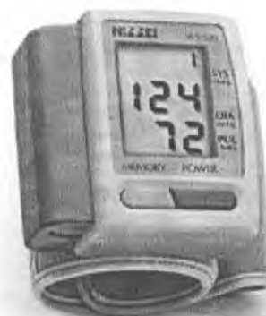
Рисунок 14 – Измеритель WS-520