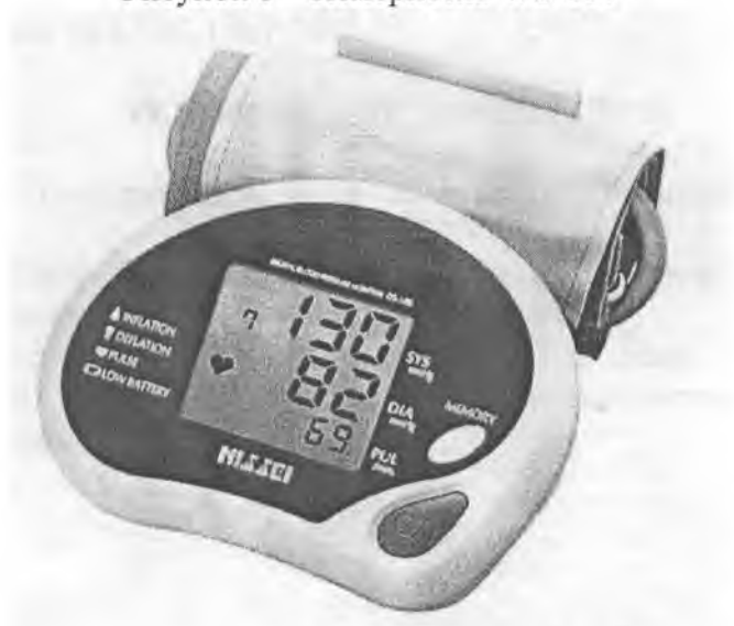
Рисунок 3 – Измеритель DS-186