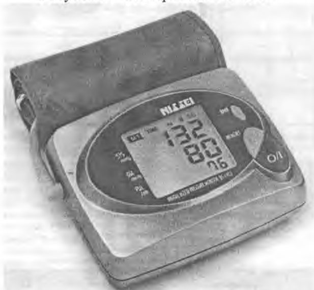
Рисунок 4 – Измеритель DS-1902