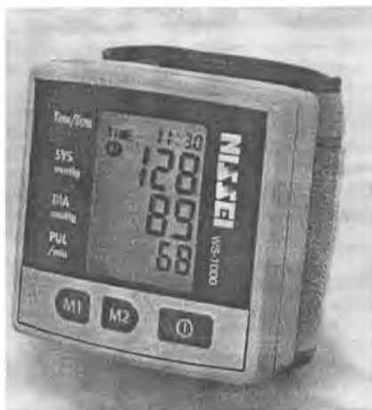
Рисунок 7 – Измеритель WS-1000