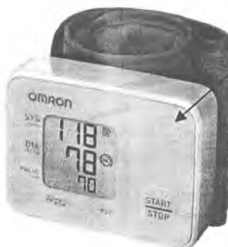
Рисунок А.9 – Внешний вид измерителя RS1 (HEM-6120-E)

место нанесения знака поверки (клеймо-наклейка)