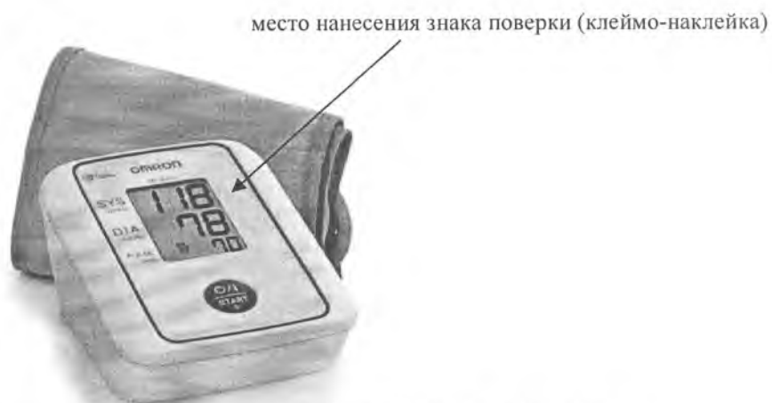
Рисунок А.4 – Внешний вид измерителя M2 Basic (HEM-7116H-RU), M2 Basic (HEM-7116H-ARU)