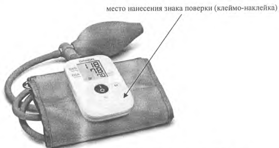
Рисунок А.1 – Внешний вид измерителя M1 (HEM-4030-E), S1 (HEM-4030-RU)

Внешний вид измерителей артериального давления автоматических и полуавтоматических OMRON серии HEM