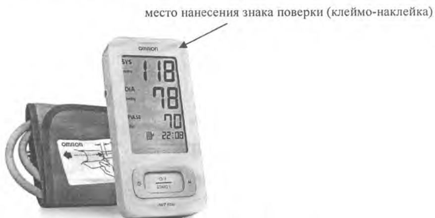
Рисунок А.5 – Внешний вид измерителя MIT Elite (HEM-7300-WE7)