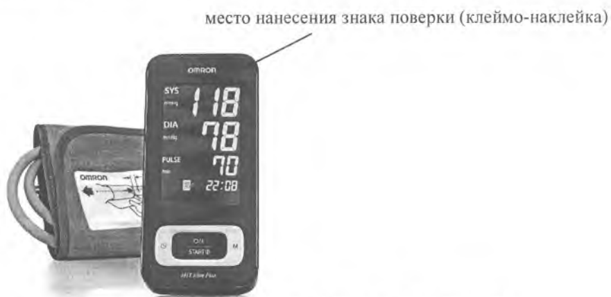
Рисунок А.6 – Внешний вид измерителя MIT Elite Plus (HEM-7301-ITKE7)