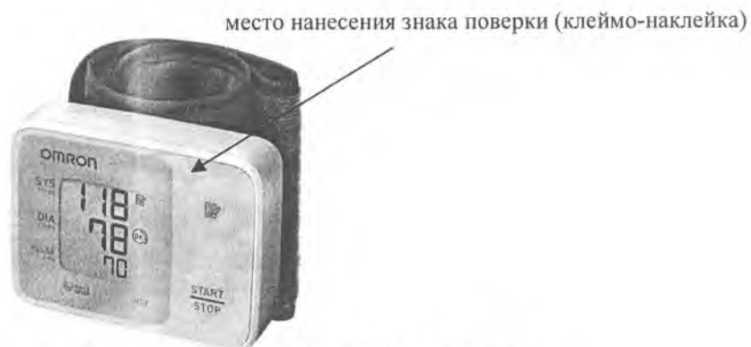
Рисунок А.10 – Внешний вид измерителя RS2 (HEM-6121-E)