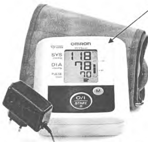
Рисунок А.7 – Внешний вид измерителя M2 Classic (HEM-7117H-ARU)

место нанесения знака поверки (клеймо-наклейка)