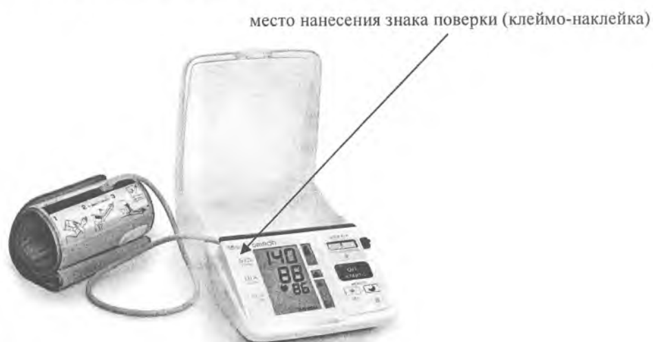
Рисунок А.2 – Внешний вид измерителя iC-10 (HEM-7070-E)