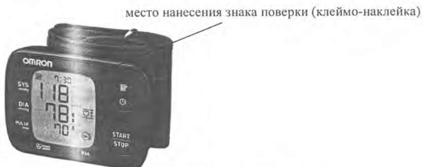
Рисунок А.12 – Внешний вид измерителя RS6 (HEM-6221-E)