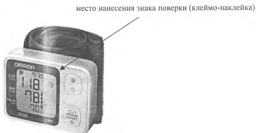
Рисунок А.11 – Внешний вид измерителя RS3 (HEM-6130-E)