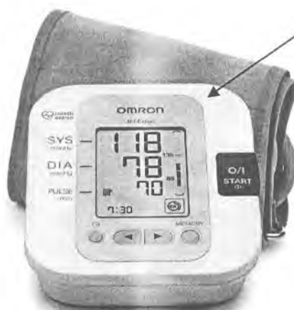
Рисунок А.8 – Внешний вид измерителя M3 Expert (HEM-7200H-ARU)

место нанесения знака поверки (клеймо-наклейка)