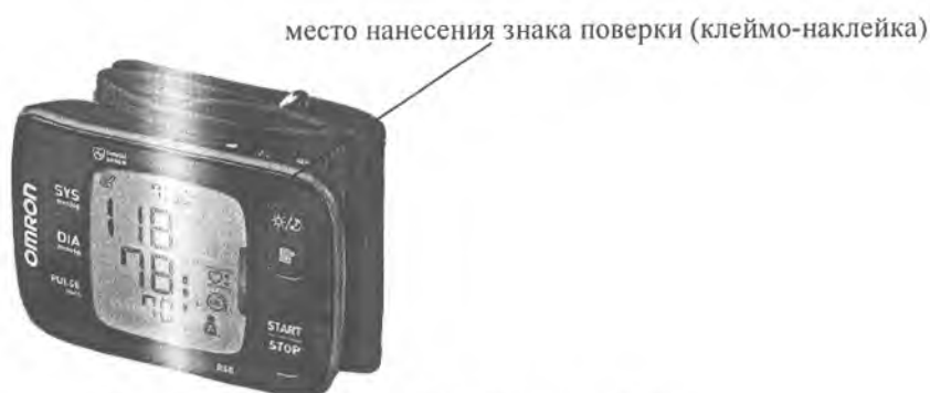
Рисунок А.13 – Внешний вид измерителя RS8 (HEM-6310F-E)