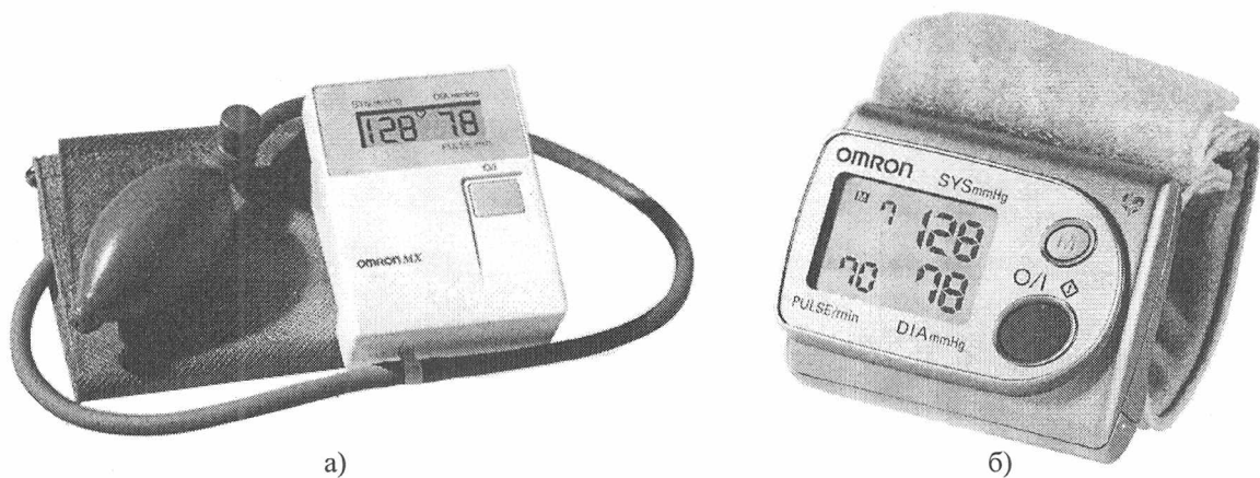
Рисунок 1 а) – измеритель артериального давления MX б) - измеритель артериального давления RX