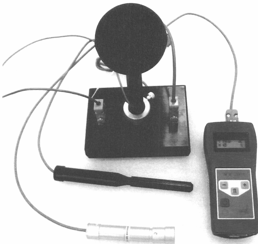
Рисунок 1 – Внешний вид прибора контроля параметров воздушной среды "Метеометр МЭС-200А"