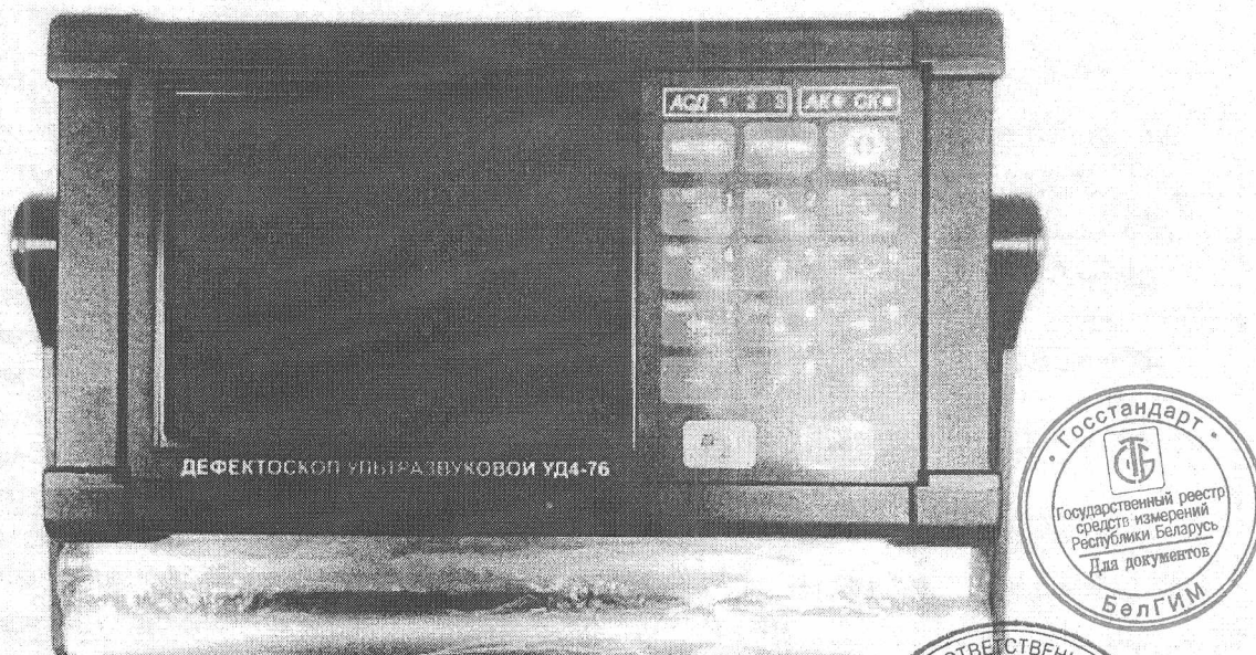
Рисунок 1 - Общий вид дефектоскопов ультразвуковых УД4-76

Схема пломбировки от несанкционированного доступа представлена на рисунке 2.