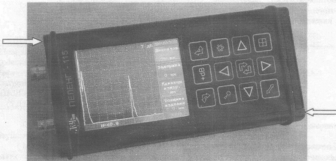
Рисунок 1 - Общий вид дефектоскопов «ПЕЛЕНГ-115» (УД2-115) и места нанесения пломбировки.

Фотография дефектоскопа представлена на рисунке 1.