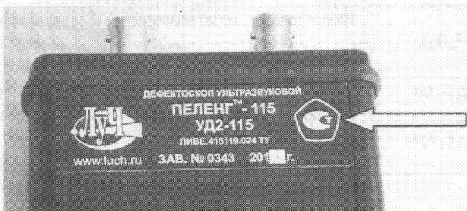
Рисунок 2 – Шильд задней панели и место нанесения клейма.

В основу работы дефектоскопа положена способность ультразвуковых колебаний (УЗК) распространяться в контролируемых изделиях и отражаться от внутренних дефектов и границ материалов. Дефектоскоп реализует эхо-импульсный, теневой и зеркально-теневой методы ультразвукового неразрушающего контроля. Отображение полученных сигналов на дисплее осуществляется в виде развертки типа А (А-скан).