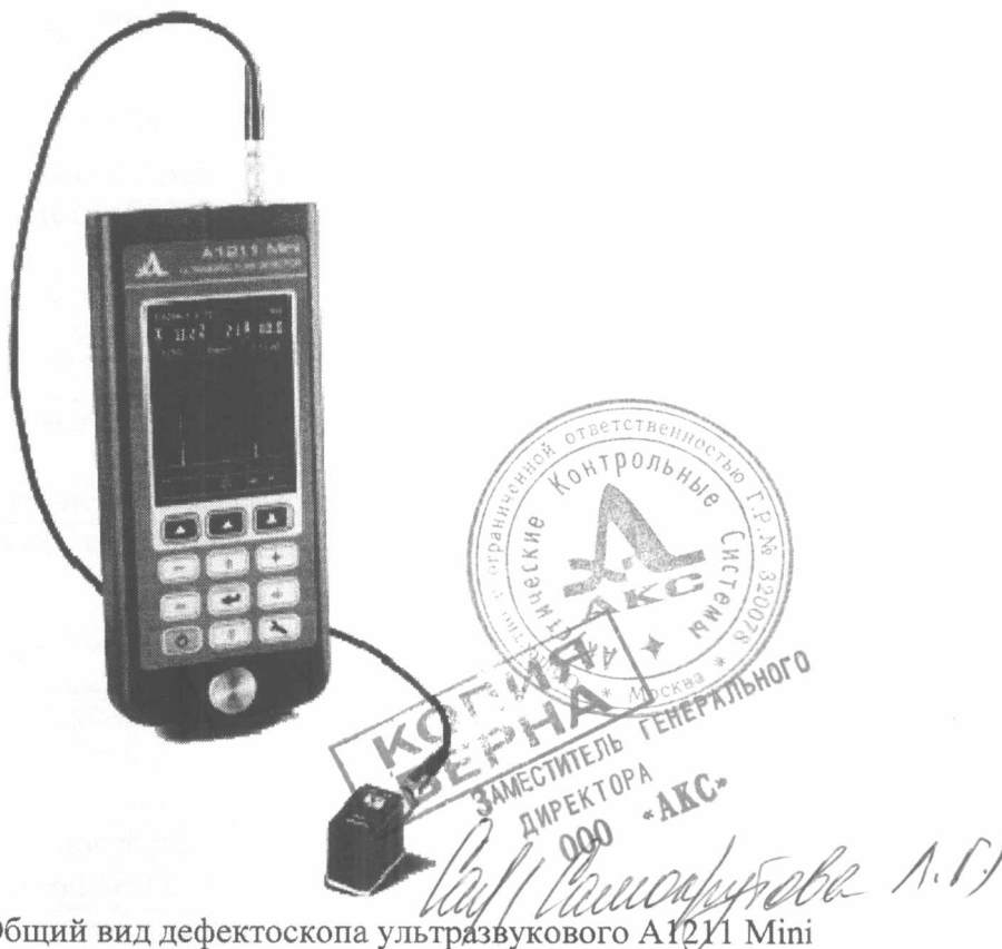
Рисунок 1 – Общий вид дефектоскопа ультразвукового А1211 Mini

Фотография общего вида дефектоскопа представлена на рисунке 1.