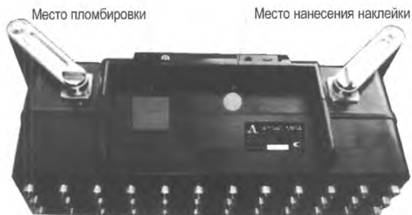
Рисунок 2 – Место пломбировки корпуса томографа и место нанесения наклейки