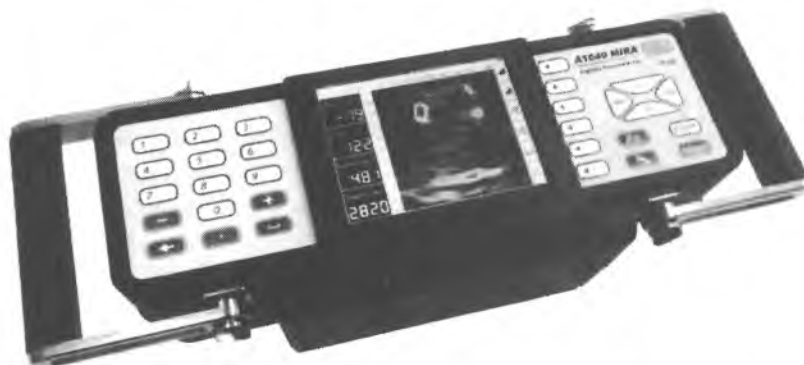
Рисунок 1 – Томограф ультразвуковой низкочастотный A1040 MIRA

Внешний вид томографа представлен на рисунке 1.