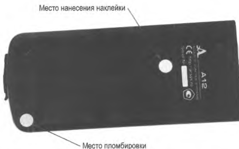
Рисунок 2 – Место пломбировки корпуса толщиномера и место нанесения наклейки

Принцип действия толщиномеров состоит в измерении времени двойного прохода ультразвуковых (УЗ) импульсов через объект контроля (ОК), которое пересчитывается в значение толщины ОК при известной скорости УЗ.