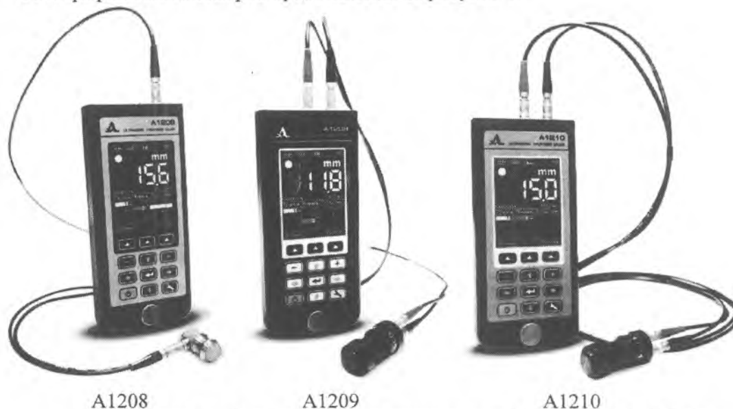
Рисунок 1 – Толщиномеры ультразвуковые А1208, А1209, А1210

Фотографии толщиномеров представлены на рисунке 1.