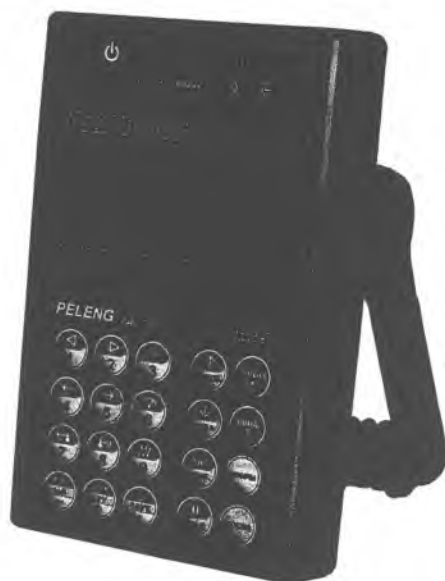
Рисунок 1 – Общий вид дефектоскопа