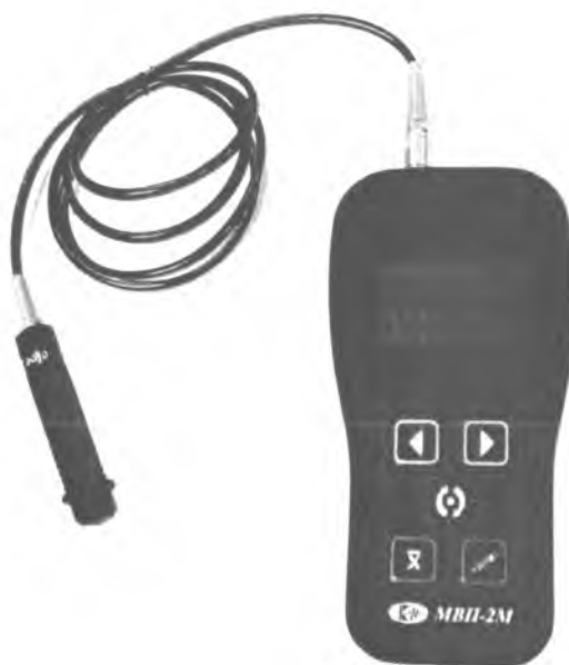
Рисунок 1 - Общий вид прибора вихретокового многофункционального МВП-2М

Прибор МВП-2М состоит из электронного блока и измерительного преобразователя, соединенных гибким кабелем. Фотография общего вида прибора МВП-2М представлена на рисунке 1.