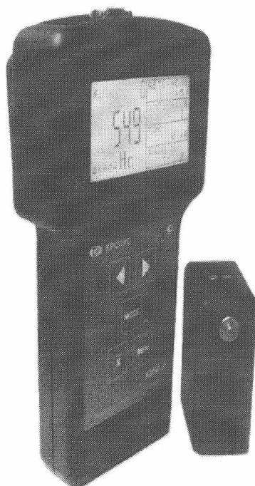
Рис. 1 Общий вид

Коэрцитиметры состоят из электронного блока и измерительного преобразователя в виде приставного электромагнита со съемными полюсными наконечниками.