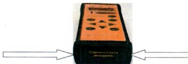
Рисунок 3 - Схема пломбировки от несанкционированного доступа