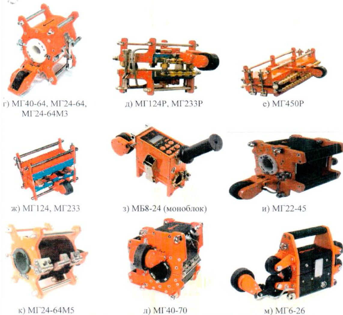
Рисунок 2 - Общий вид магнитных головок