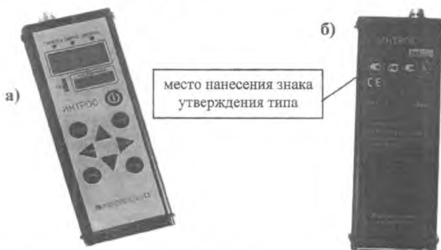
Рисунок 1 - Общий вид электронного блока (ЭБ) и место нанесения знака утверждения типа. а) - лицевая сторона ЭБ, б) - обратная сторона ЭБ

В дефектоскопе реализован магнитный метод неразрушающего контроля. Принцип работы дефектоскопа заключается в следующем. Магнитная система МГ намагничивает участок контролируемого каната. Магнитные поля рассеяния, вызванные дефектами каната, создают на выходе блока датчиков электрический сигнал, который, после усиления и преобразования в цифровую форму, обрабатывается в микропроцессоре. Получаемая информация запоминается и выводится на светодиодные индикаторы ЭБ, а также может быть передана на внешний компьютер для хранения, обработки и последующего анализа. В МБ8-24 МГ и ЭБ совмещены в одном корпусе (рис. 2 з).