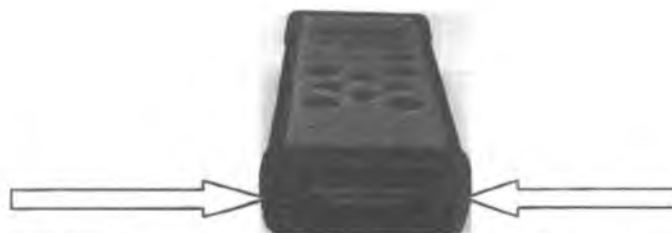
Рисунок 3. Места нанесения пломбировки в измерителе износа стальных канатов (дефектоскопе) ИНТРОС (вид с торца).