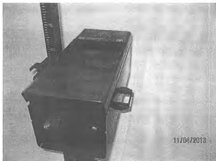
Рисунок 1 - Приборы проверки фар модели ОПК.