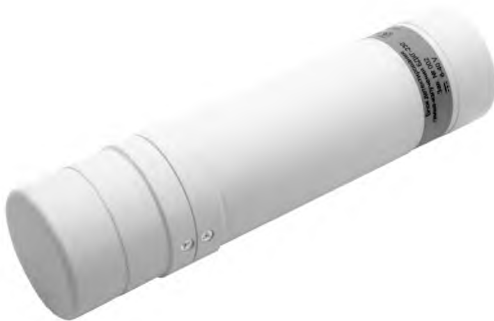
Рисунок 1 – Внешний вид БД

Место нанесения знака поверки (клейма-наклейки) приведено на рисунке 2.