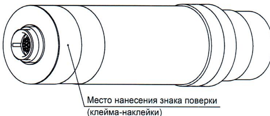
Рисунок 2 – Место нанесения знака поверки (клейма-наклейки)

Место нанесения знака поверки (клейма-наклейки) приведено на рисунке 2.