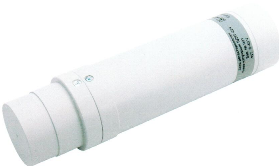
Рисунок 1 – Внешний вид БД

Место нанесения знака поверки (клейма-наклейки) приведено на рисунке 2.