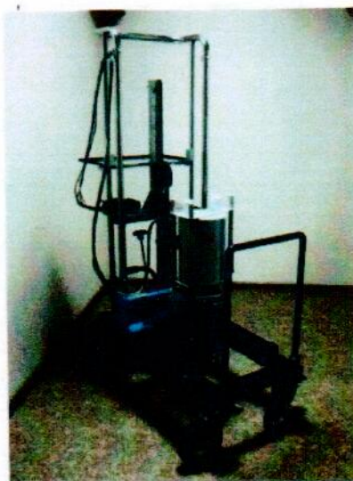
Рисунок 8 - Внешний вид тележки с комплексом для вариантов исполнения Эко ПАК-01-1, Эко ПАК-02-1, Эко ПАК-03-1