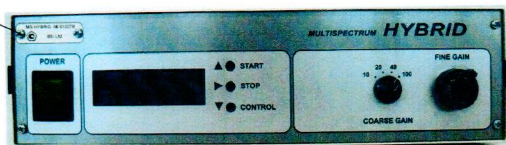
Рисунок 6 - Внешний вид CY Multispectrum HYBRID

место пломбировки и размещения знака утверждения типа