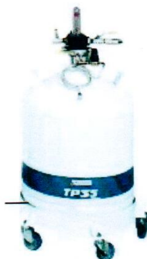
Рисунок 9 - Внешний вид устройства для хранения и заливки жидкого азота TP35