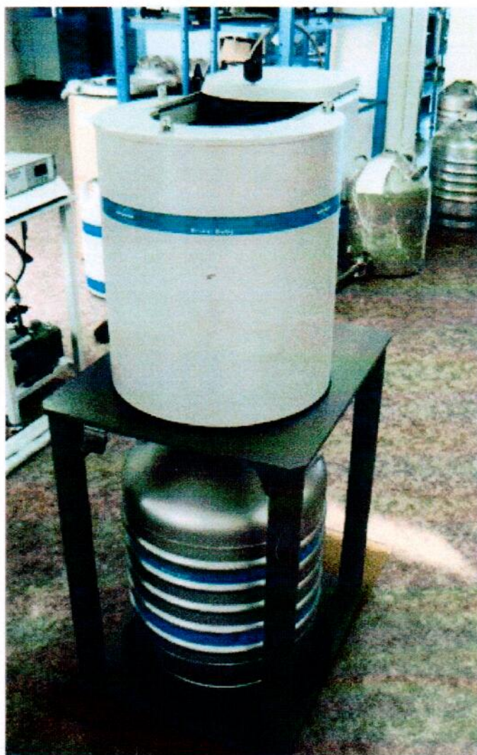
Рисунок 4 - Внешний вид комплекса вариантов исполнения Эко ПАК-01-3, Эко ПАК-02-3, Эко ПАК-03-3 с НЗК

место пломбировки и размещения знака утверждения типа