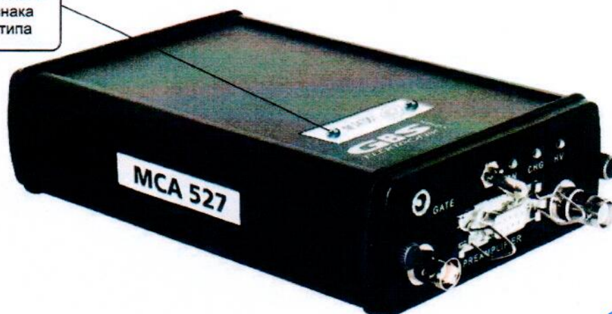
Рисунок 5 - Внешний вид СУ MCA-527

место пломбировки и размещения знака утверждения типа