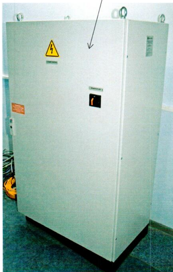
Рисунок 2.1 – Схема (рисунок) с указанием места для нанесения знака поверки средств измерений

Место для нанесения знака поверки средств измерений (передняя стенка станции управления установкой)