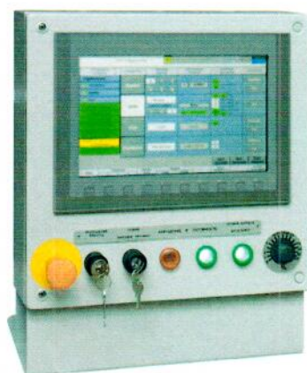
пульт ручного управления