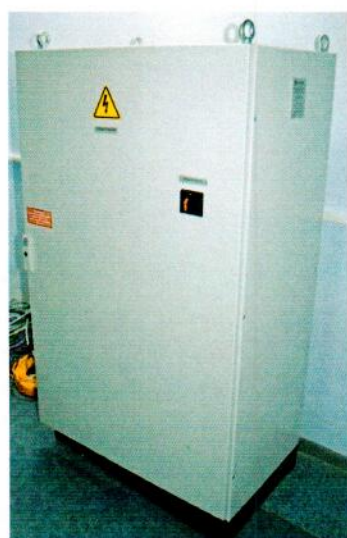
станция управления установкой