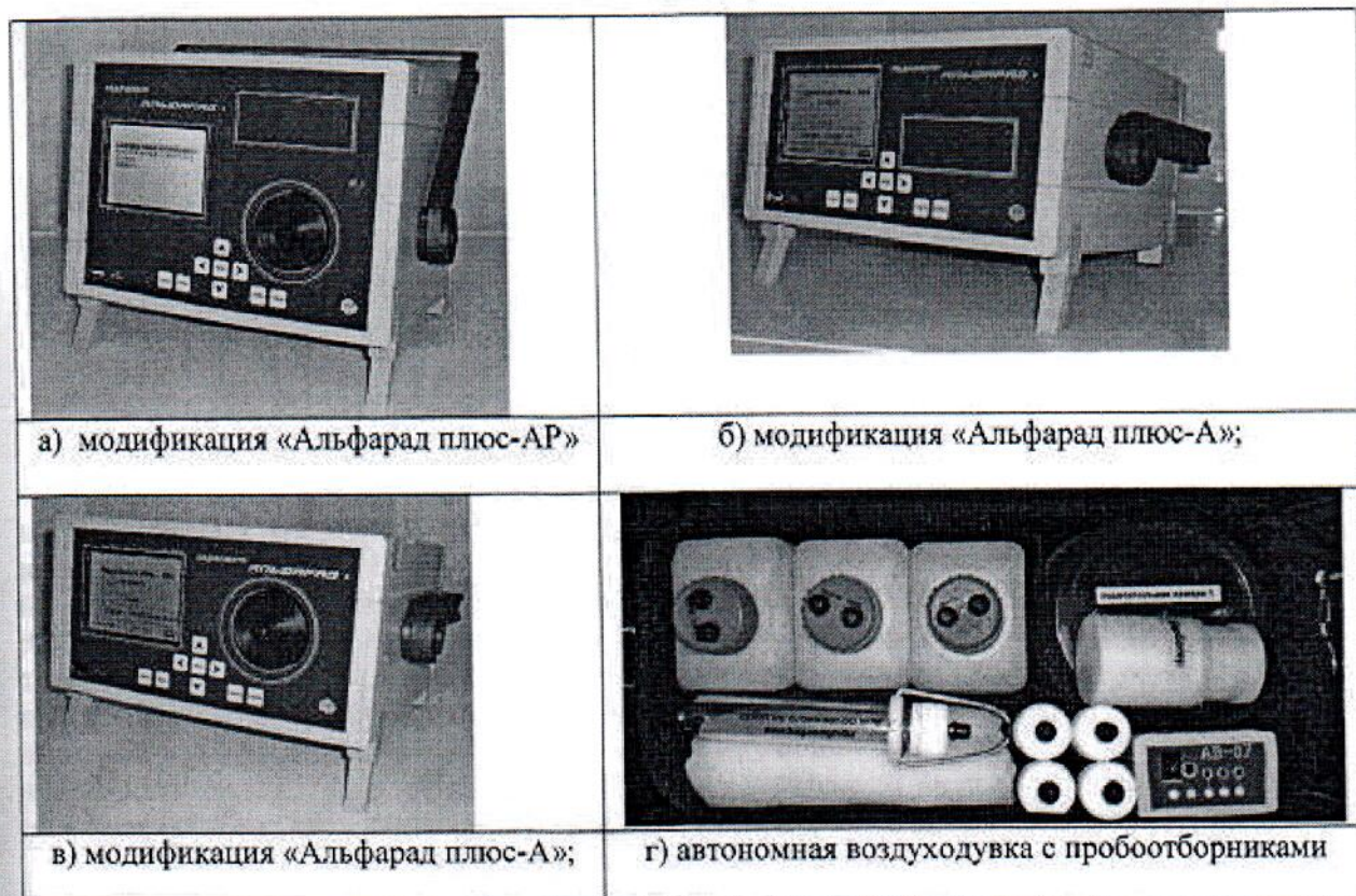
Рисунок 1 Внешний вид блоков Комплекса трех модификаций и автономной воздуходувки с пробоотборными устройствами.