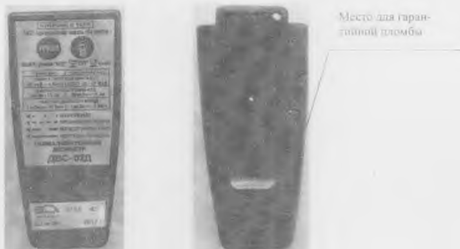
Рисунок 2 – Общий вид дозиметра в исполнении 01

Дозиметры опломбированы в соответствии с конструкторской документацией ФВКМ 412113.052. Место пломбирования представлено на рисунке 1п.2.