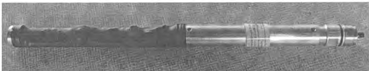
Рисунок 1 – Общий вид блоков