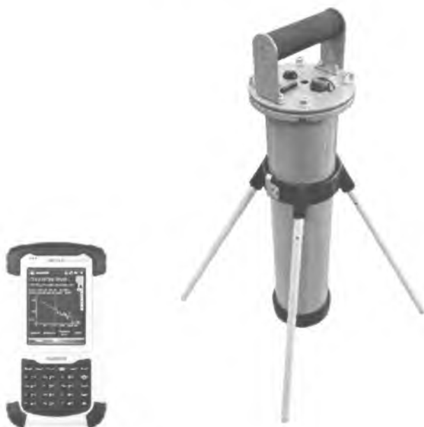
Рисунок 1 – Внешний вид спектрометров

Общий вид спектрометров приведен на рисунке 1.