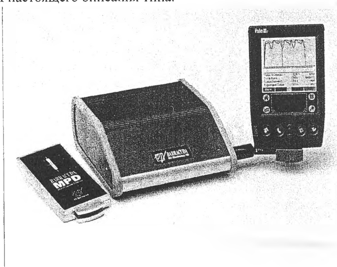
Рисунок 1. Внешний вид мультиметра

Место нанесения оттиска государственного поверительного клейма приведено в приложении А настоящего описания типа.