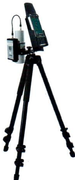
Рисунок 4 – Прибор в составе с БДКГ-30, БОИ4 и адаптером BT-DU4 на штативе