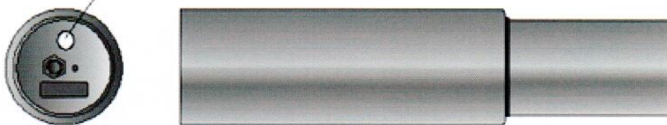
Рисунок 12 – Место нанесения знака поверки (клейма-наклейки) на БД

Место нанесения клейма-наклейки поверителя