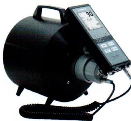
Рисунок 2 – Прибор в составе с БДКН-03 и БОИ2