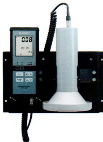
Рисунок 3 – Прибор в составе с БДПБ-02 и БОИ2 в варианте размещения на вертикальной поверхности