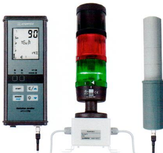
Рисунок 6 – Прибор в составе с БДКГ-01, устройством сигнализации и БОИ2