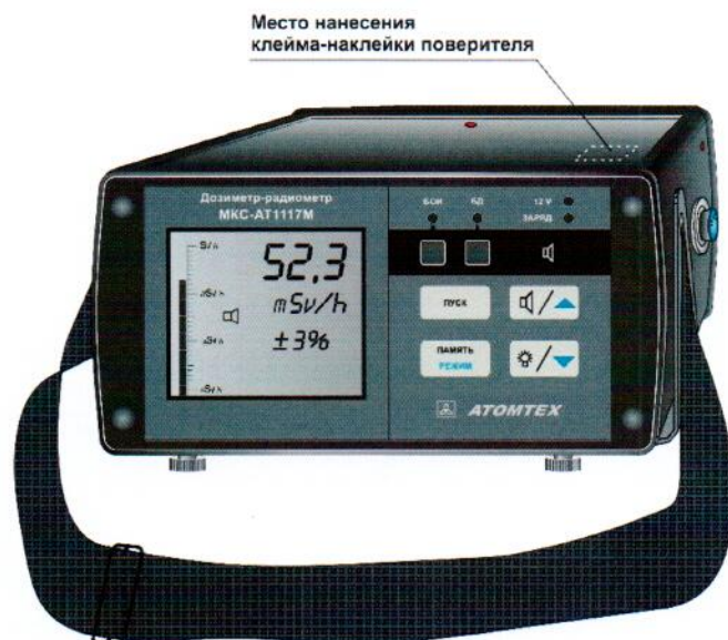
Рисунок 9 – Место нанесения знака поверки (клейма-наклейки) на БОИ