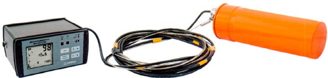
Рисунок 7 – Прибор в составе с БДКГ-01 в гермоконтейнере и БОИ