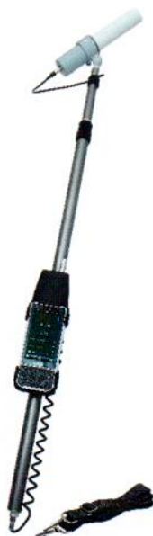
Рисунок 5 – Прибор в составе с БДКГ-01, БОИ4 на штанге