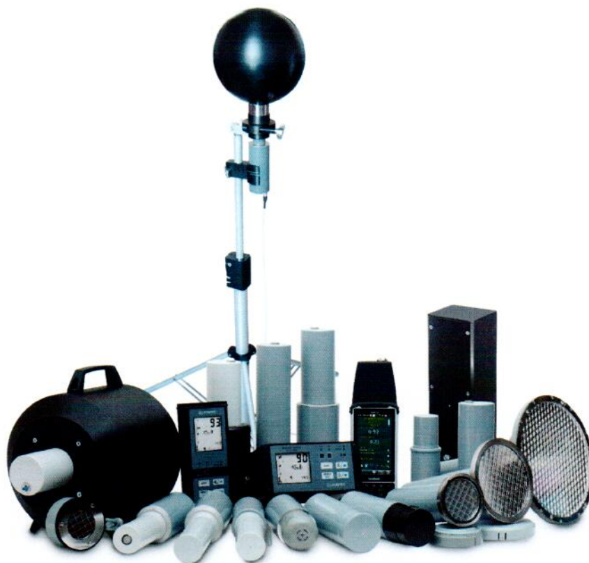
Рисунок 1 – Общий вид прибора