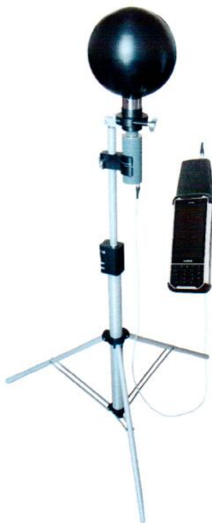
Рисунок 8 – Прибор в составе с БДКН-06