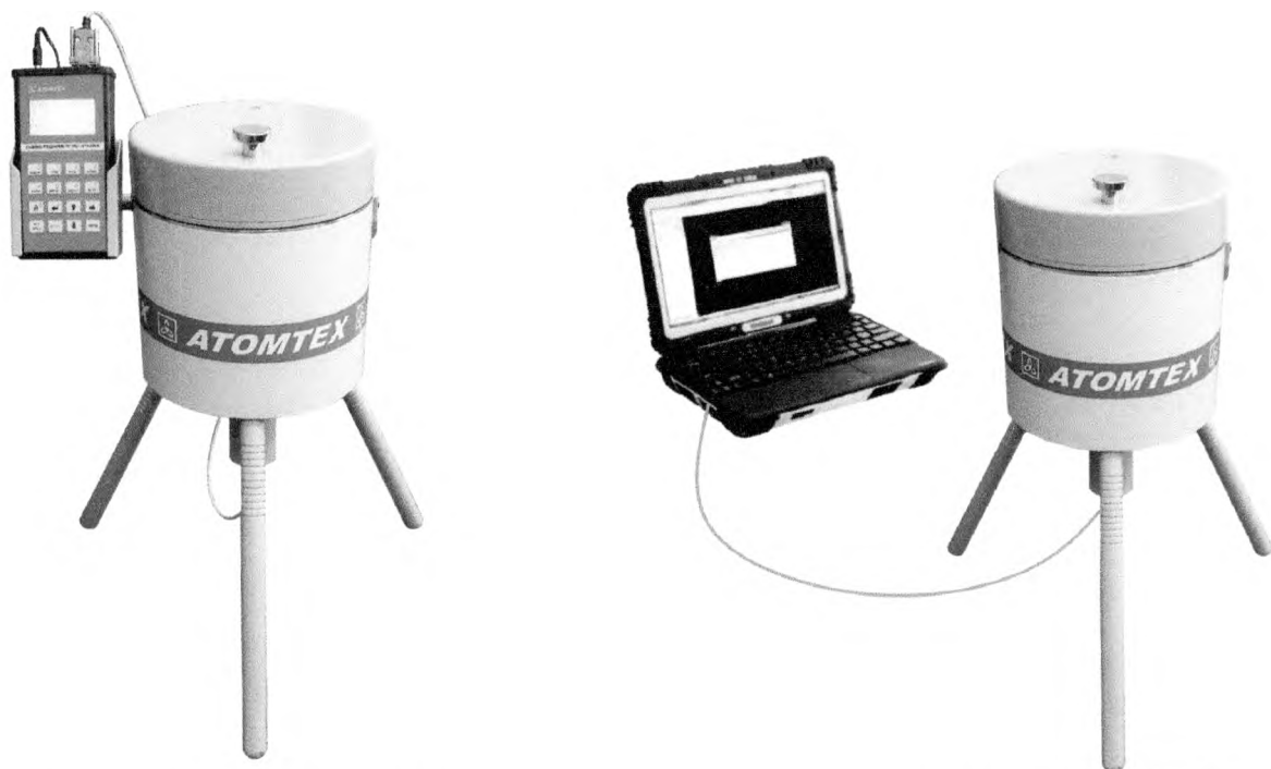
а) РКГ-АТ1320, РКГ-АТ1320А, РКГ-АТ1320В

Общий вид радиометров представлен на рисунке 1.