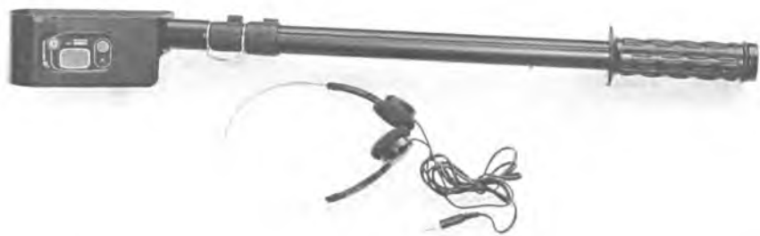
Рисунок 1 – Внешний вид измерителя-сигнализатора поискового ИСП-PM1701М

Общий вид прибора представлен на рисунке 1.