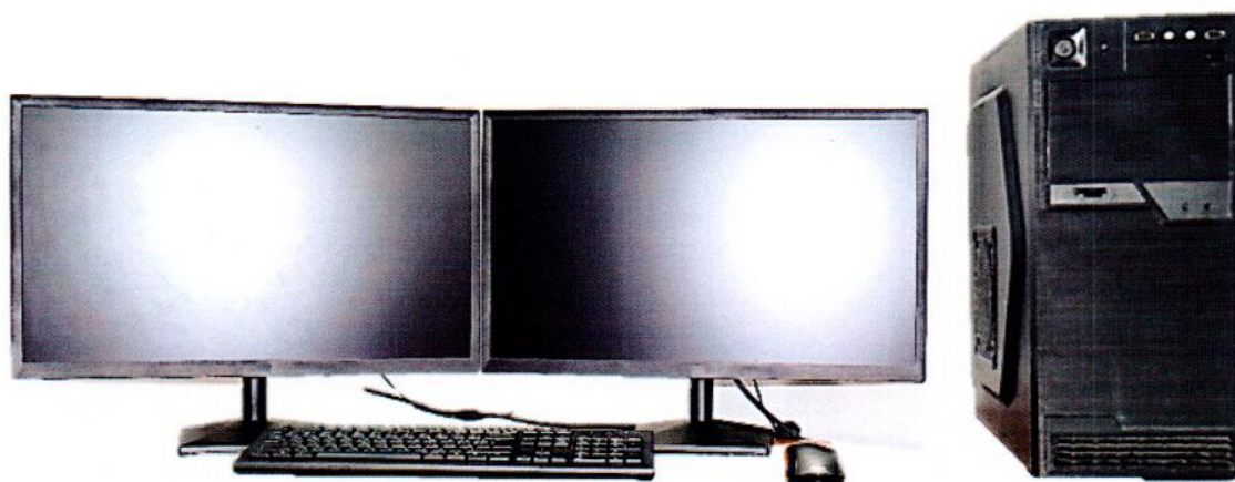
б) автоматизированное рабочее место оператора