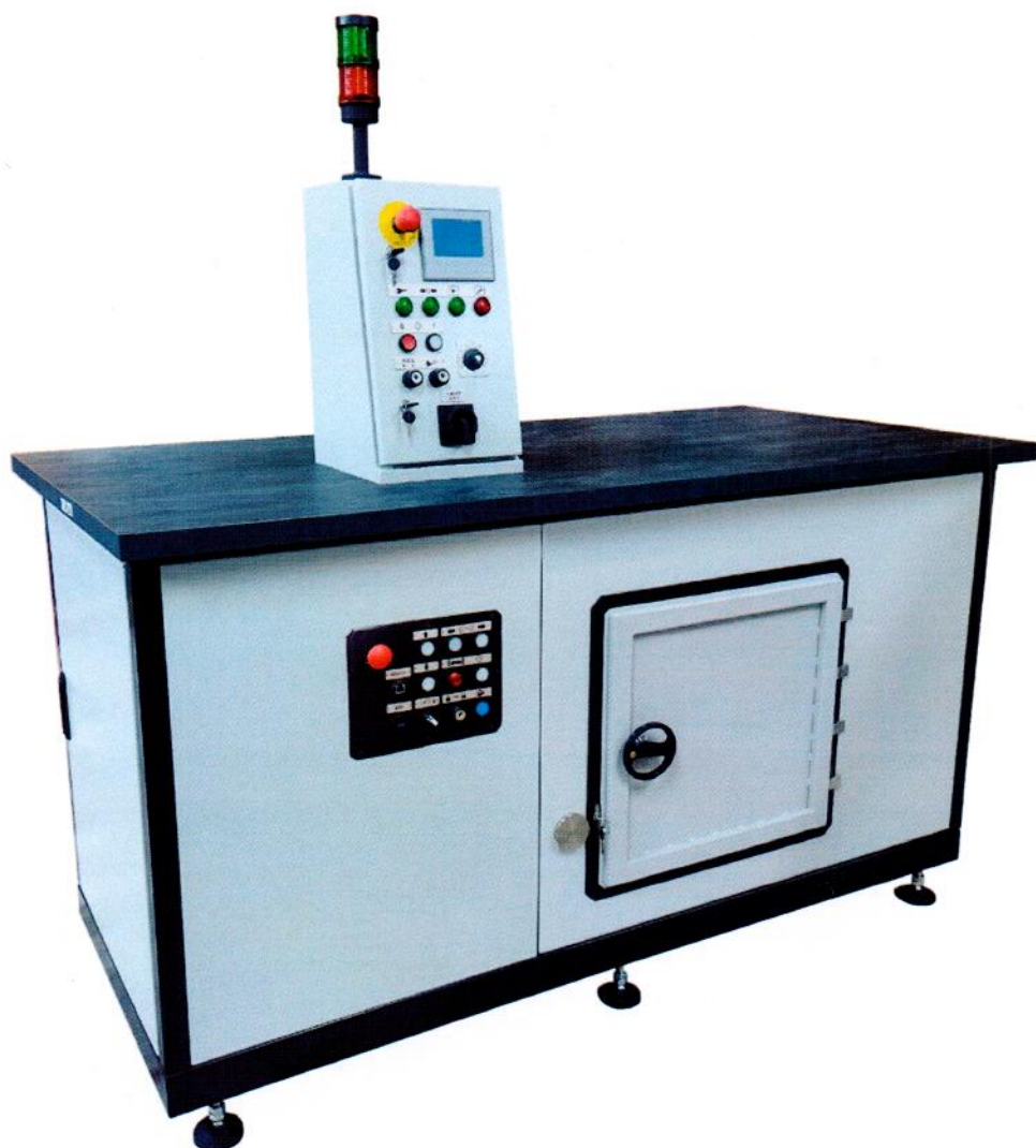
а) калибратор гамма-излучения