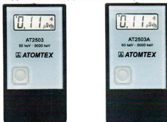
Рисунок 1 – Общий вид дозиметров ДКГ-АТ2503, ДКГ-АТ2503А

Общий вид дозиметров ДКГ-АТ2503, ДКГ-АТ2503А приведен на рисунке 1.