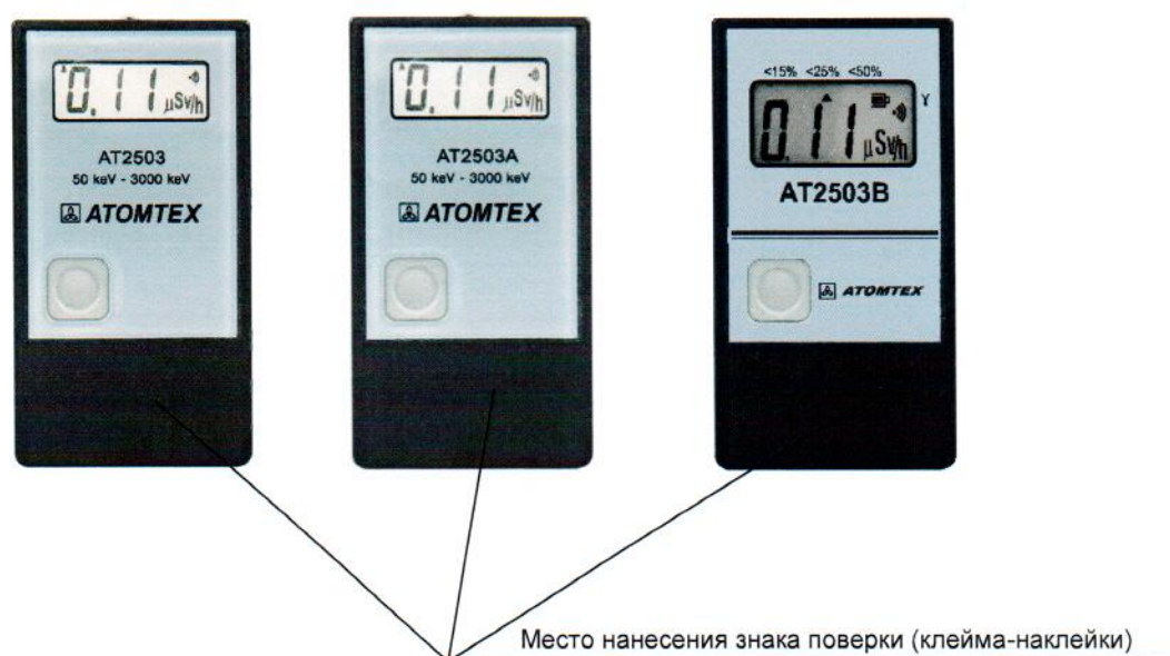
Рисунок 4 – Место нанесения знака поверки (клейма-наклейки)

Место нанесения знака поверки (клейма-наклейки) приведено на рисунке 4.