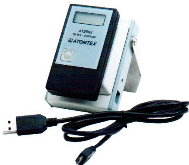
Рисунок 3 – Общий вид дозиметров совместно с устройством считывания

Общий вид дозиметров совместно с устройством считывания приведен на рисунке 3.