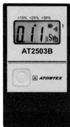
Рисунок 2 – Общий вид дозиметров ДКГ-АТ2503В, ДКГ-АТ2503В/1, ДКГ-АТ2503В/2

Общий вид дозиметров индивидуальных ДКГ-АТ2503В, ДКГ-АТ2503В/1, ДКГ-АТ2503В/2 приведен на рисунке 2. Обозначение модификации дозиметра отображается на этикетке, на задней крышке дозиметра.