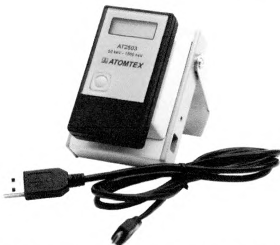
Рисунок 3 – Общий вид дозиметров совместно с устройством считывания

Общий вид дозиметров совместно с устройством считывания приведен на рисунке 3.