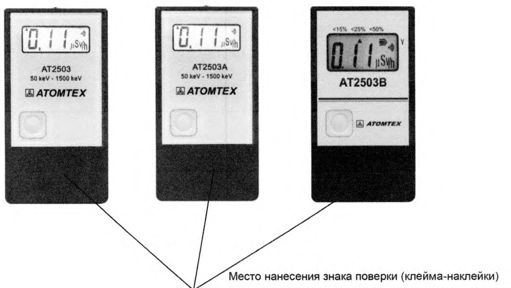
Рисунок 4 – Место нанесения знака поверки (клейма-наклейки)

Место нанесения знака поверки (клейма-наклейки) приведено на рисунке 4.