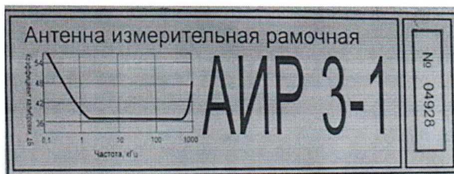
Рисунок 1.2 – Фотография маркировки антенны измерительной рамочной АИР 3-1 № 04928