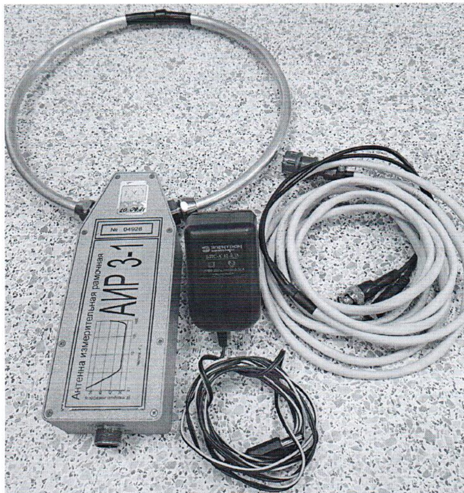
Рисунок 1.1 – Фотография общего вида антенны измерительной рамочной АИР 3-1 № 04928