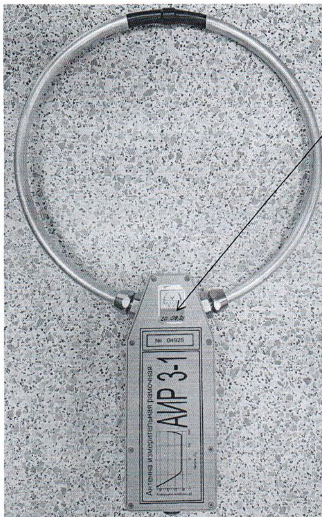
Рисунок 2.1 – Схема (рисунок) с указанием места для нанесения знака поверки средств измерений