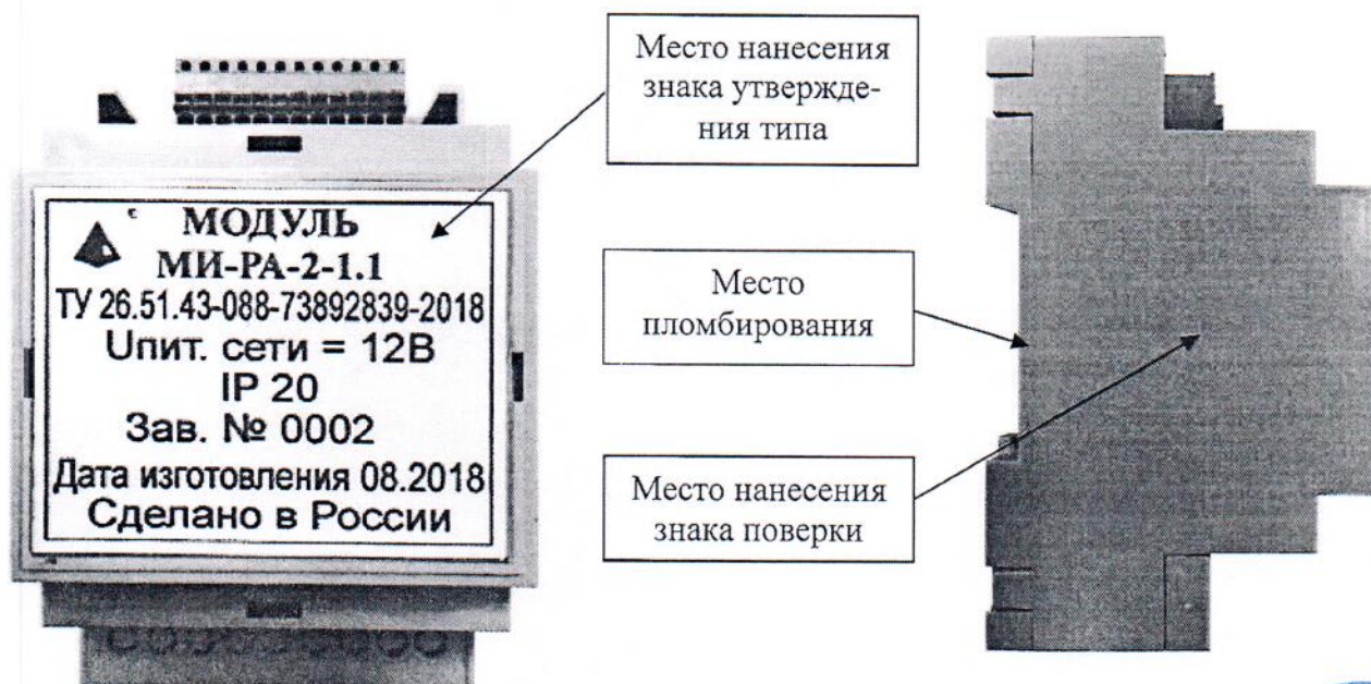
Рисунок 1 – Общий вид модулей с указанием мест пломбирования, нанесения знака поверки и знака утверждения типа

Общий вид модулей с указанием мест пломбирования, нанесения знака поверки и знака утверждения типа представлен на рисунке 1.