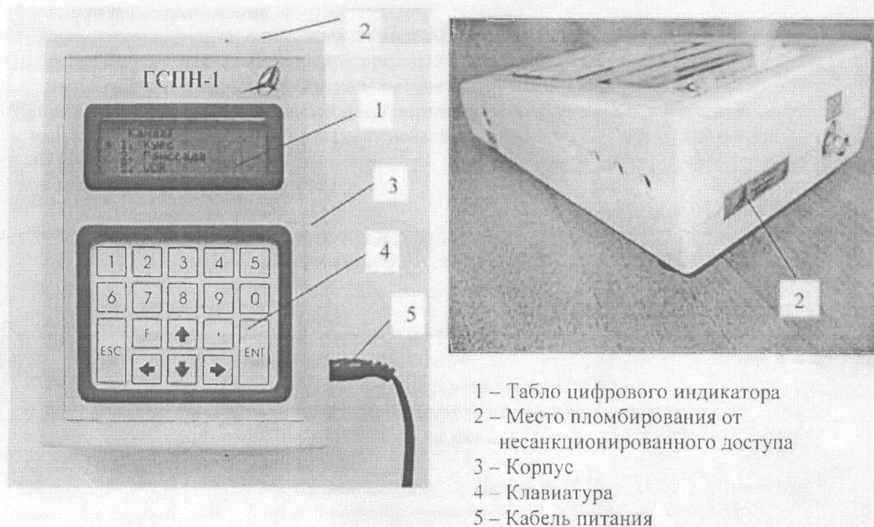
Рисунок 1 — Внешний вид генератора сигналов посадки и навигации ILS, VOR «ГСПН-1»

От несанкционированного доступа генераторы сигналов посадки и навигации ILS, VOR «ГСПН-1» защищены фирменной наклейкой.