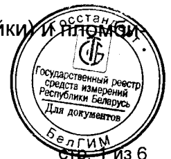
Схема с указанием мест нанесения знака поверки (клейма-наклейки) и пломбирования приведена в приложении А к описанию типа.

Общий вид осциллографов приведен на рисунке 1.