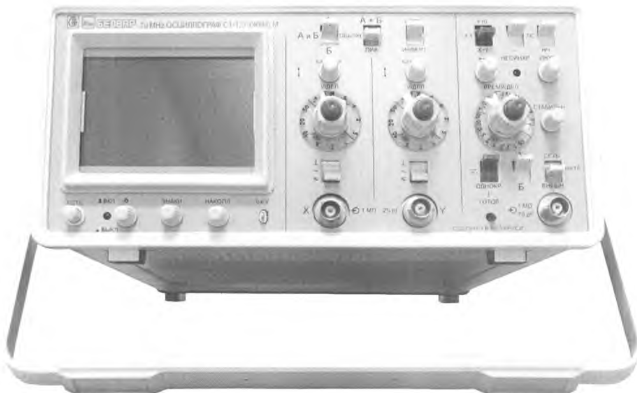
Рисунок 1 - Осциллограф С1-127 (ЖКИ) М. Внешний вид.

Влияние ПО учтено при нормировании метрологических характеристик осциллографов. Идентификационные данные ПО приведены в таблице 1. Метрологически значимые параметры не могут быть изменены потребителем без повреждения пломб.