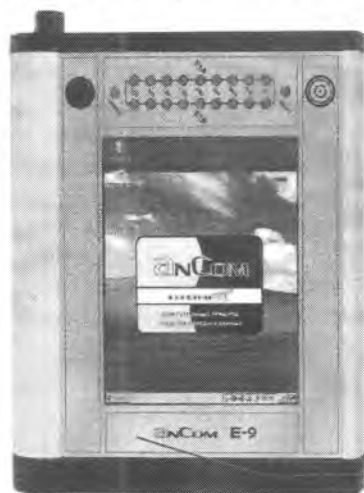
Рисунок 1. Внешний вид анализатора

Внешний вид анализатора и место защиты от несанкционированного доступа, изображены на рисунках 1 и 2 соответственно.