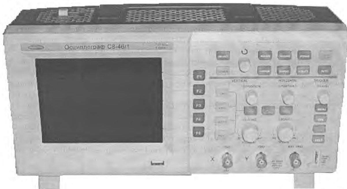
Рисунок 1 – Осциллографы C8-46/1, C8-46/2, C8-46/3. Внешний вид.

Схема с указанием мест для нанесения поверительного клейма и знака поверки в виде клейма-наклейки приведена в приложении А, рисунок А.1.