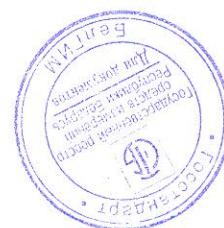
Схема пломбирования генераторов от несанкционированного доступа с указанием мест для нанесения оттиска клейма поверителя приведена в приложении А.

Внешний вид генераторов приведен на рисунке 1.1.