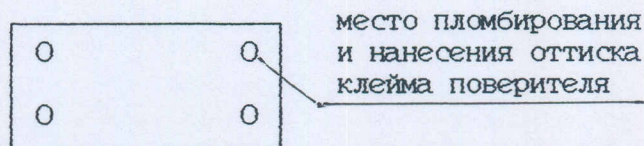
Рисунок 1 - Вид сзади

Место пломбирования и нанесения клейма поверителя указано на рисунке 1.