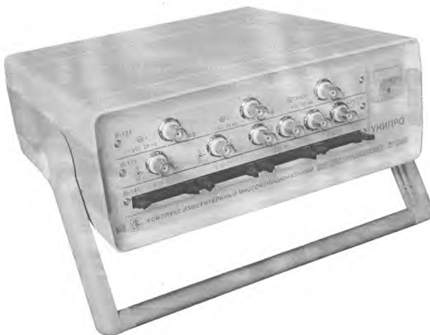
Рисунок 1 – комплекс измерительный многофункциональный УНИПРО

Внешний вид комплекса приведен на рисунке 1.