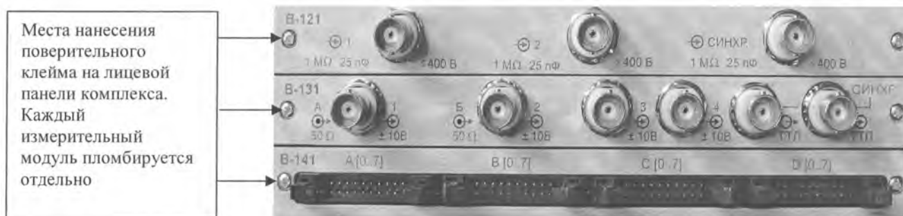
Рисунок А.1 – Схема пломбирования комплекса УНИПРО