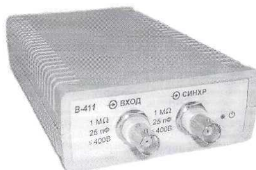
Рисунок 4 – Осциллограф В-411