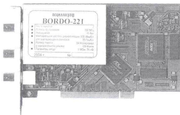
Рисунок 2 – Осциллограф В-221