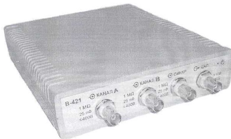
Рисунок 5 – Осциллограф В-421

Схемы пломбирования различных модификаций осциллографов от несанкционированного доступа с указанием мест для нанесения оттиска поверительного клейма и мест расположения клейма-наклейки приведены в приложении А.