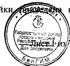
Схема с указанием нанесения знака поверки в виде клейма-наклейки приведена в приложении А, рисунок А.1.

Схема с указанием мест для нанесения оттиска знака поверки приведена в приложении А, рисунок А.1.