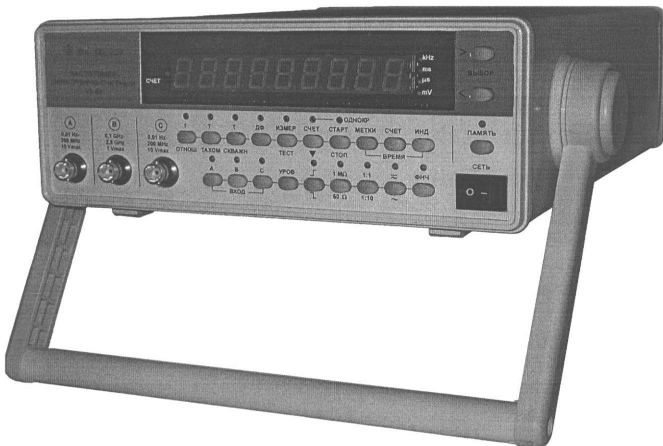
Рисунок 1 – Частотомер электронно-счетный ЧЗ-88. Внешний вид.